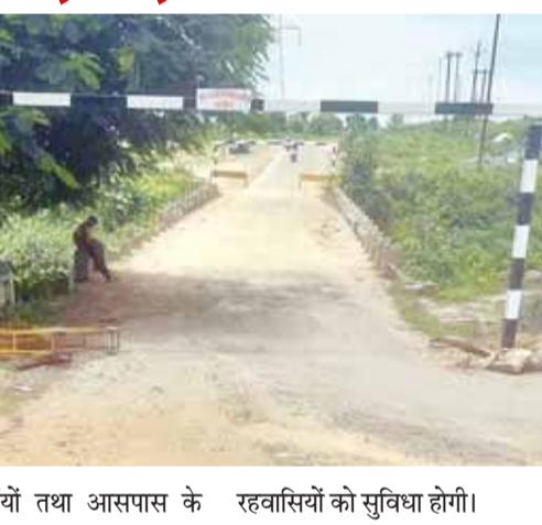
के विद्यार्थियों तथा आसपास के रहवासियों को सुविधा होगी।